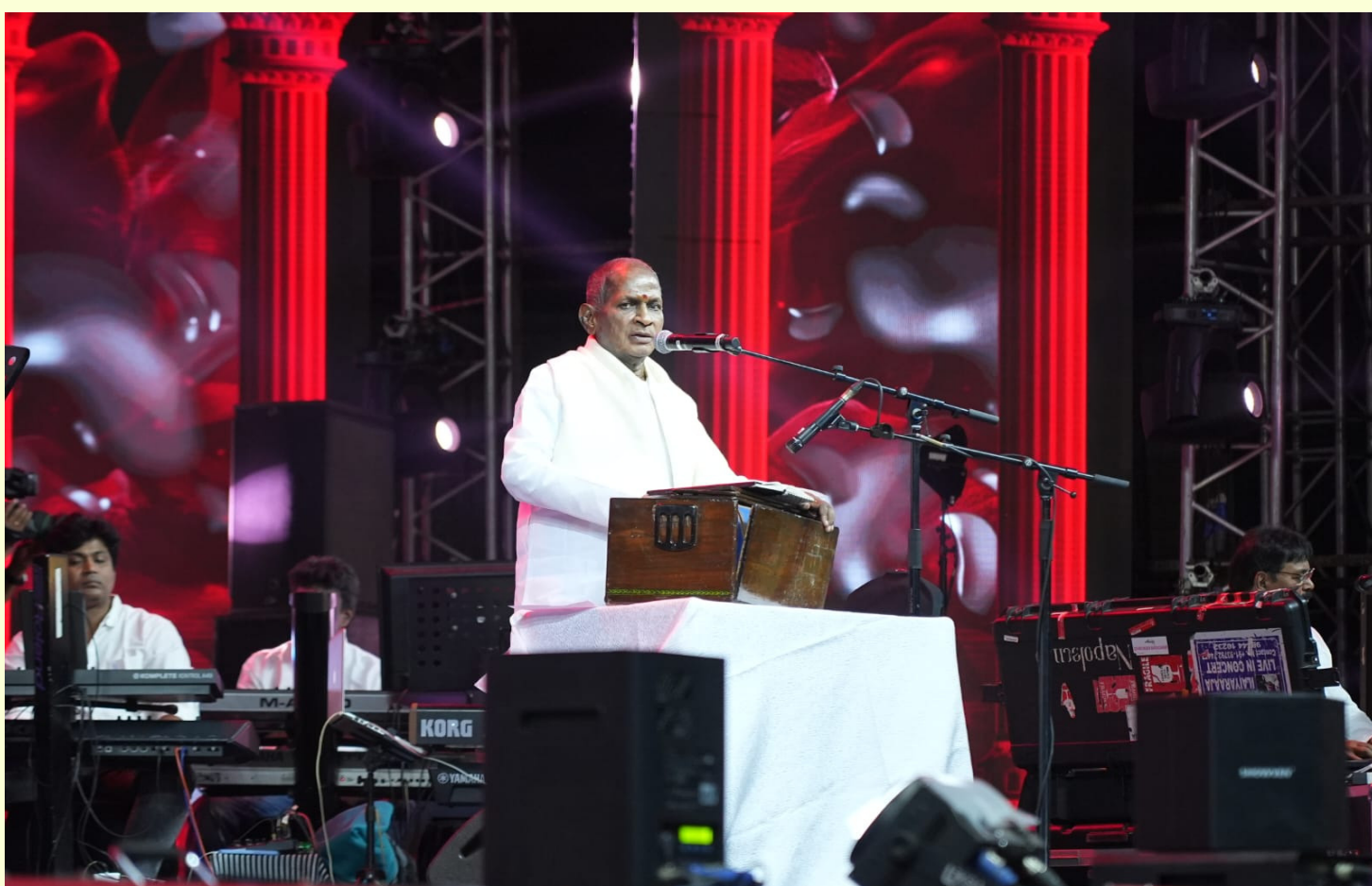
లక్ష్మీ, ఇషా రెబ్బా, వర్ష బోల్లమ్మ..చాలా మంది ప్రముఖులు హాజరయ్యారు. లైవ్ షో లో కళాతపస్వి కె విశ్వనాథ్ కి అంజలి ఘటించారు ఇళయరాజా. సాగరసంగమం, స్వాతి మత్తులోని వేదం అణువణువున తకిల తధిమి తందాన, మౌనమేలనోయి, లాలి లాలి పాటలతో కె విశ్వనాథ్ కి నివాళి అర్పించారు. తాజా లైవ్ షోలో ఎక్కువగా యువత కనిపించింది. స్టేడియంలోని అన్ని సెక్షన్ లు నిండిపోయాయి. షో పూర్తయ్యే వరకూ ఫుల్ క్రౌడ్ వుంది. తాము అభిమానించే పాటల స్వరకర్తని ప్రత్యేకంగా చూసి ? ఇలాంటి పాటల రాత్రులు మళ్ళీ మళ్ళీ రావాలని మేస్ట్రో మ్యూజికల్ నైట్ ని ఎంజాయ్ చేశారు వీక్షకులు.

ప్రేక్షకులకు వివరించారు రాజా. ఎన్ని లేయర్లలో వర్క్ జరుగుతుందో చెప్పి.. ఇలా సంగీతాన్ని ప్రేక్షకులకు చెప్పే మ్యూజికల్ డైరెక్టర్ ఎవరైనా వున్నారా ? అని ప్రశ్నించి.. ‘ఎవరు లేరు..నేను మాత్రమే ఇలా చెప్పాను’ అని ఇచ్చిన సమాధానంతో మైదానంలో చప్పట్లు మారుమోగాయి. ఎనభై ఏళ్ల వయసులో మూడున్నర గంటల పాటలు ఒక్క సెకన్ కూడా కూర్చోకుండా ఆయన లైవ్ కండక్ట్ చేయడం అందరినీ సర్ప్రైజ్ చేసింది. ఇళయరాజా లైవ్ షో అంటే బాలు వంటే ఆ సందడే వేరు. పాటలతో పాటు మంచి సరదా కబుర్లు వుంటాయి. ఇళయరాజాని.. ఏరా అని పిలిచే చనువు బాలుకుంది. రాజా మ్యూజికల్ లోని గ్రేట్ నెస్ బాలు చెబుతుంటే ఆ మ్యూజికల్ వేరుగా వుంటుంది. అదొక్కటే ఈ షో లో మిస్ అయ్యింది. పాటల వెనుక వున్న కబుర్లు చెప్పే మనిషి కనిపించలేదు. దేవిత్రీ ప్రసాద్ ఇళయరాజాకి భక్తుడు. రాజా లైవ్ షో ఎక్కడున్న రెక్కలు కట్టుకొని వాలిపోవడం దేవిత్రీకి అలవాటు. గచ్చిబౌలి స్టేడియంలో కూడా దేవిత్రీ సందడి కనిపించింది. ప్రతి పాటకు పరపశించిపోయారు. జగడ జగడ జగడం పాటకైతే కూర్చున్న చోటే డ్యాన్స్ చేశారు. స్టేజ్ మీదకి వెళ్లి “మీ పాటకి మా మనసులు, ప్రాణాలు, జీవితాలే ఊగుతున్నాయి. రాజా గారికి దేశం భాషతో పని లేదు. ఆయన మన మనసులో నిండిపోయారు” అని తన ఆనందం పంచుకున్నారు. టాలీవుడ్ నుంచి నాని, హరీష్ శంకర్, బుచ్చిబాబు, మంచు